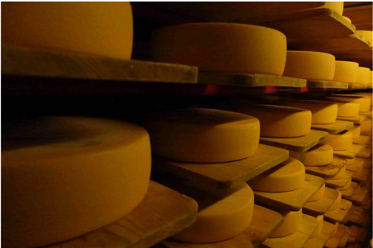
Unter ETM muss von der Weide bis in den Käsekeller alles zusammenpassen, damit sich der Erfolg einstellt.