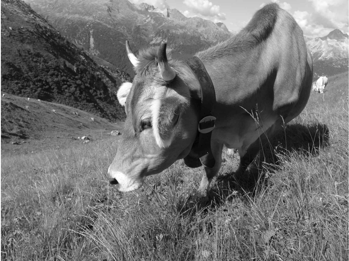
Entlegene, steile Weiden können mit ETM gezielter und besser genutzt werden.